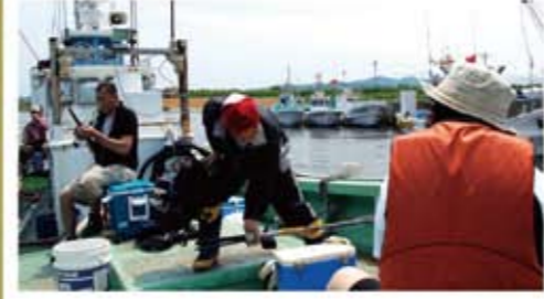
のんびりゆったり「カレイ釣りツアー」 会員数名で本号特集の「カレイ釣り」へ出かけました。