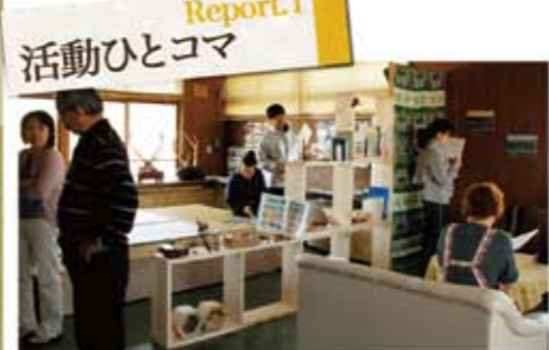
6月より正式OPEN!! 「エコハウス」 町民から旅人まで、人々の集いの場を目指しています。